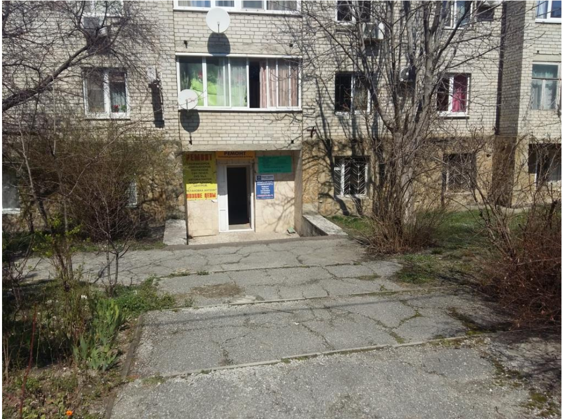
Фото № 2. Вход в цокольный этаж (со стороны ул.Полевой), где находится оцениваемое нежилое помещение