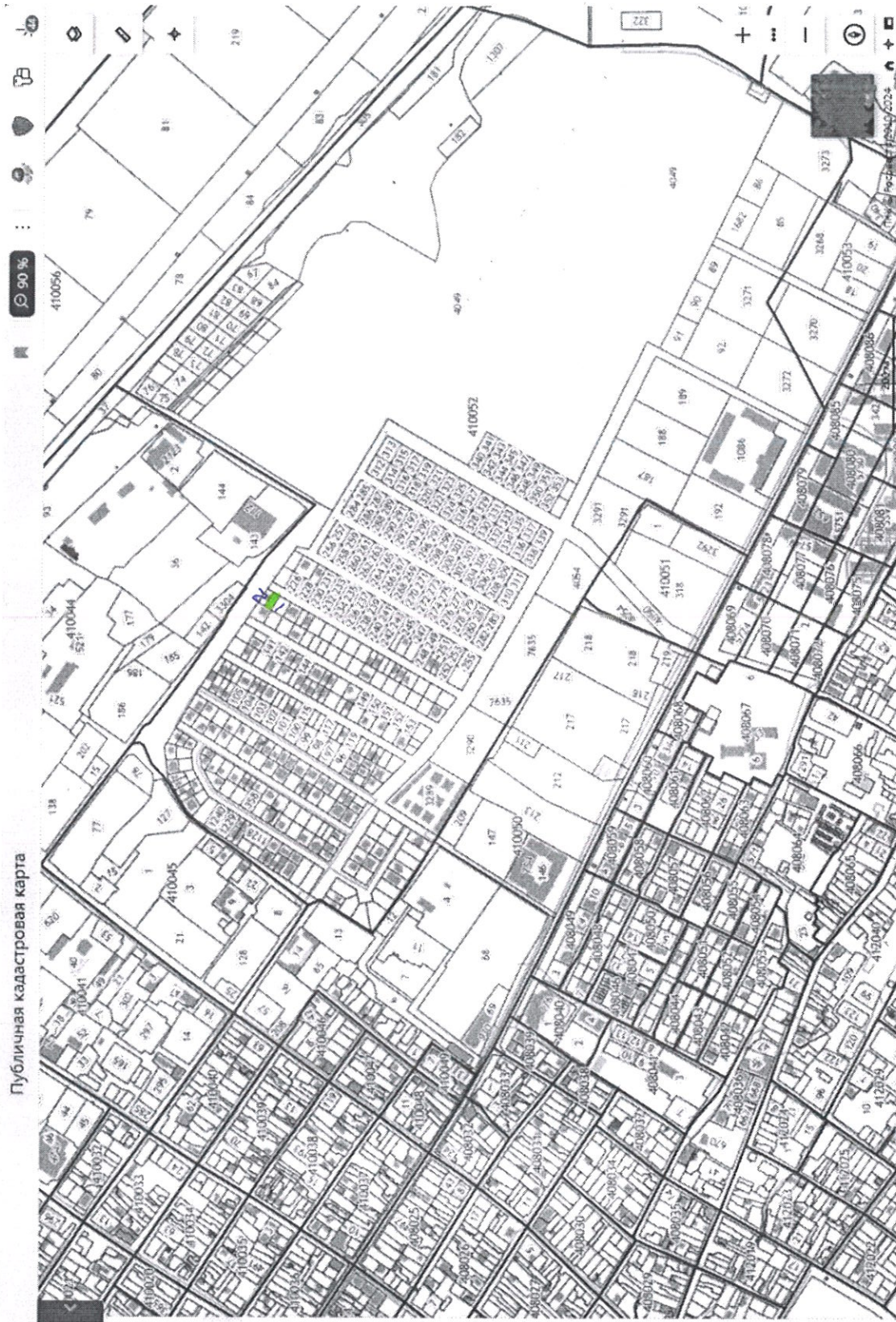
Публичная кадастровая карта

жк №2 ТС-19.04.24 Вестник №15 от 12.04.24