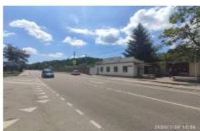
Фототаблица к Отчету об оценке № 82-20-1103/5 от 17.08.2020г.