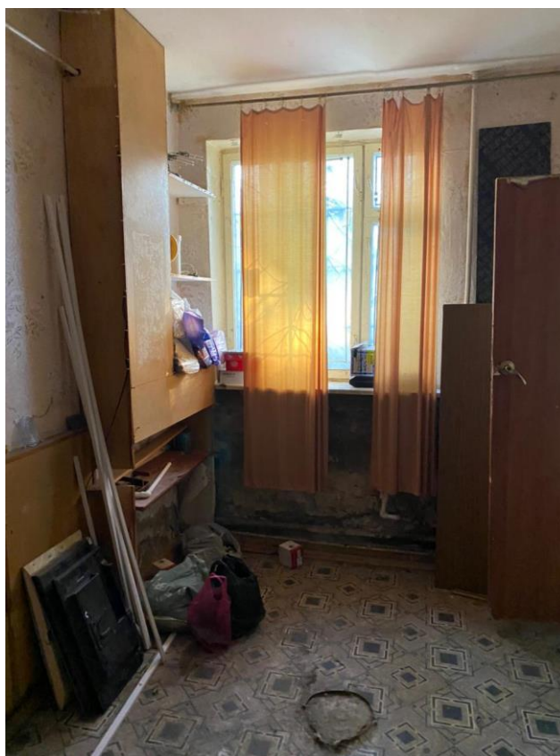
Фото № 3. Помещение № 20 (нумерация в соответствии с техническим паспортом) оцениваемого объекта