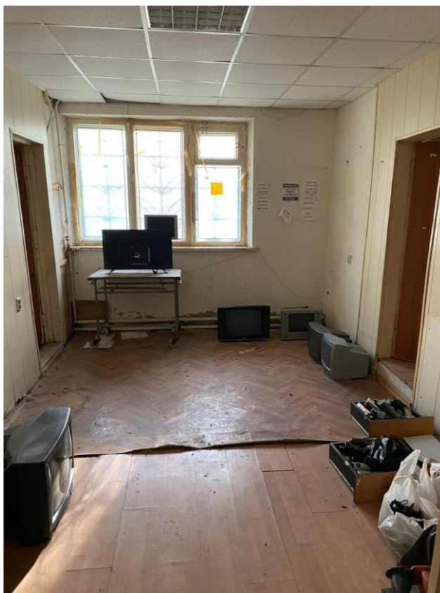
Фото № 4. Помещение № 21 (нумерация в соответствии с техническим паспортом) оцениваемого объекта