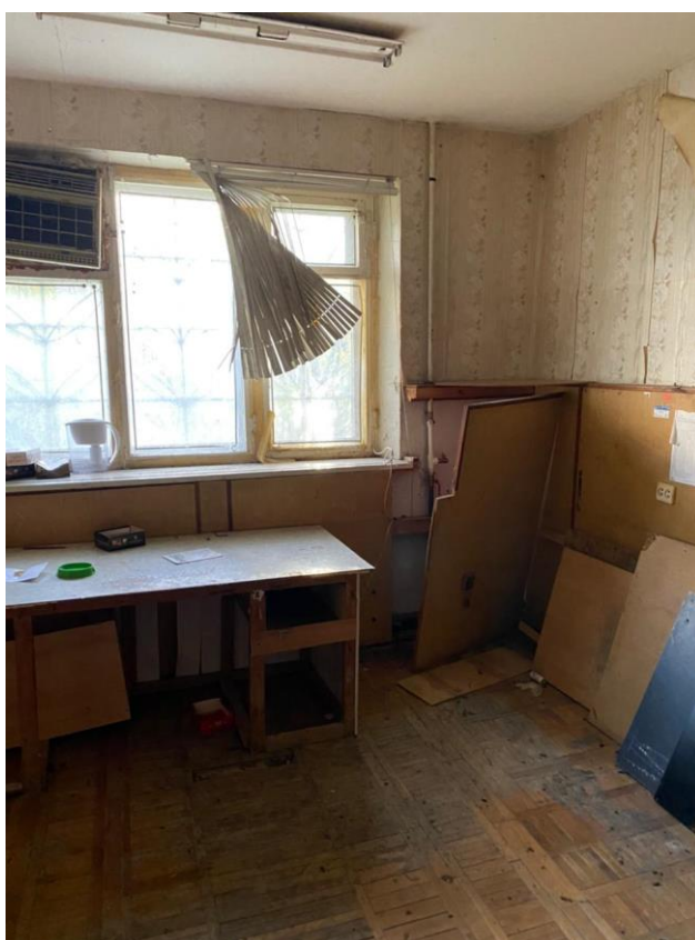
Фото № 5. Помещение № 22 (нумерация в соответствии с техническим паспортом) оцениваемого объекта