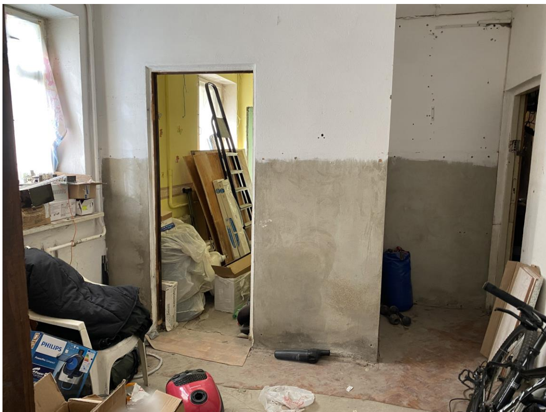
Фото № 4. Помещение № 12 (нумерация в соответствии с техническим паспортом) оцениваемого объекта