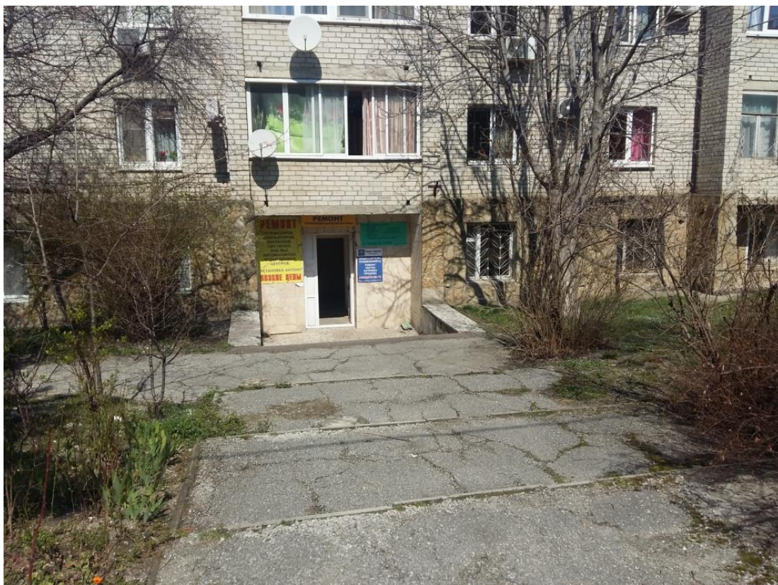
Фото № 2. Вход в цокольный этаж (со стороны ул.Полевой), где находится оцениваемое нежилое помещение