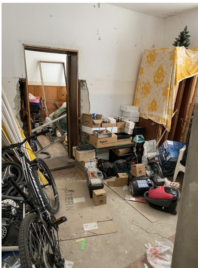
Фото № 3. Помещение № 12 (нумерация в соответствии с техническим паспортом) оцениваемого объекта