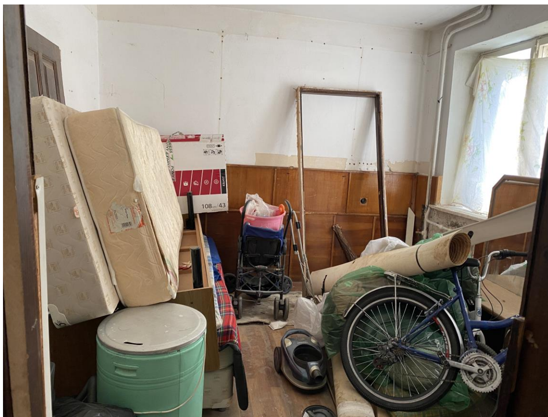
Фото № 5. Помещение № 11 (нумерация в соответствии с техническим паспортом) оцениваемого объекта