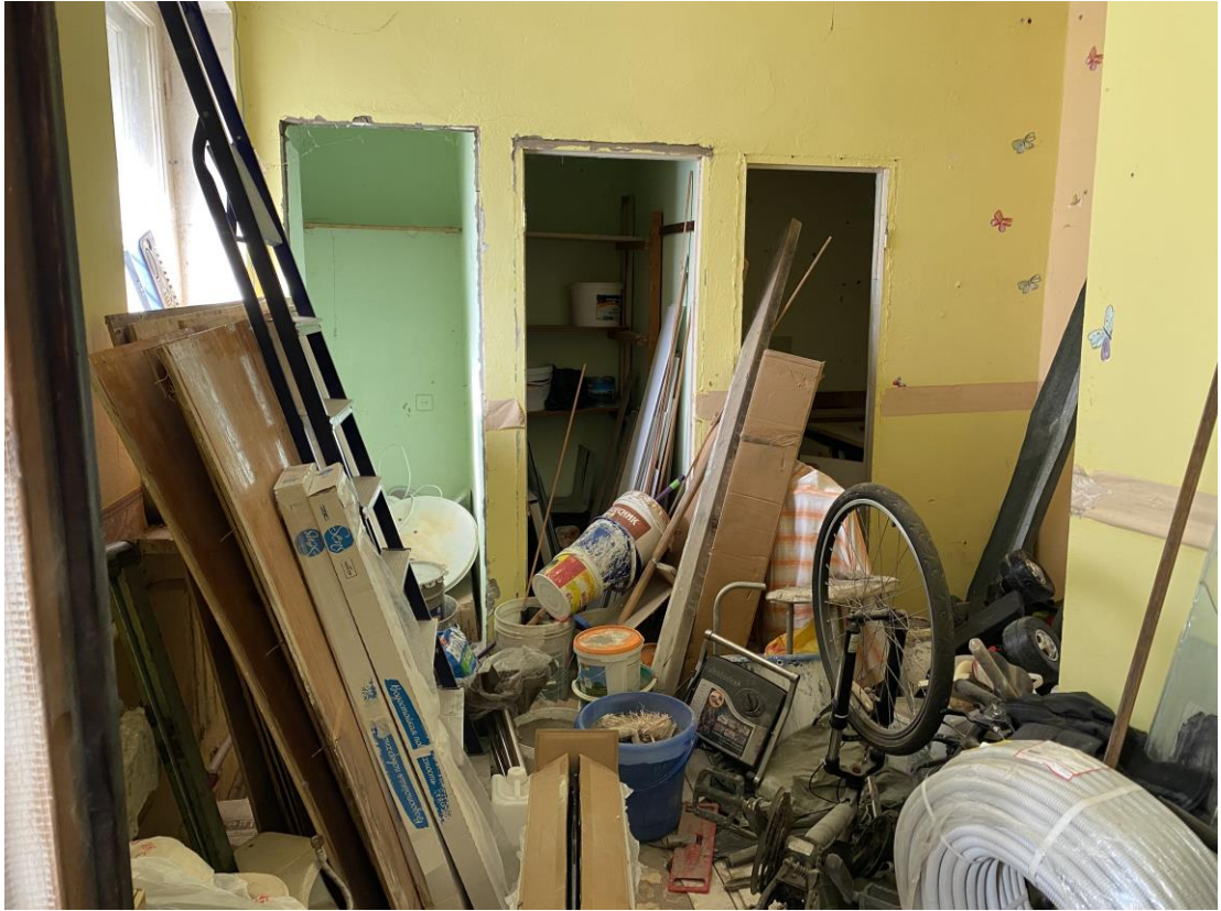
Фото № 6. Помещения № 58-61 (нумерация в соответствии с техническим паспортом) оцениваемого объекта