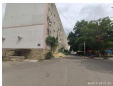
Фототаблица к Отчету об оценке № 82-20-1103/8 от 17.08.2020г.