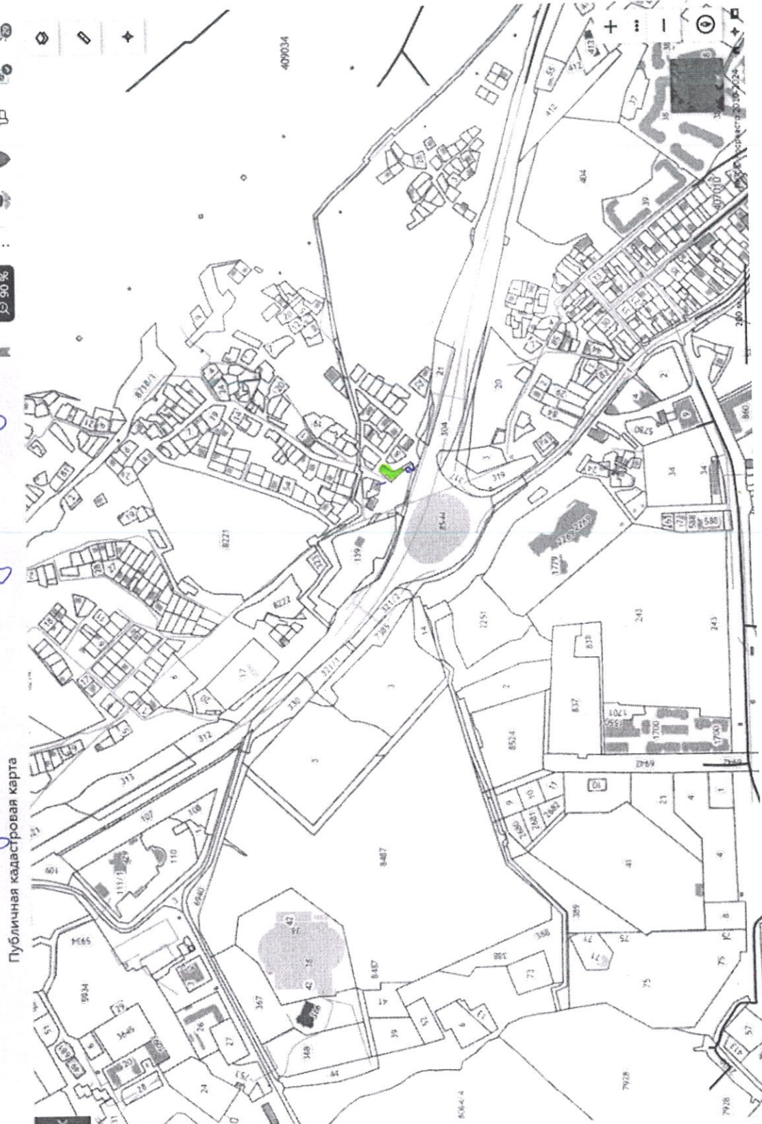
Публичная кадастровая карта