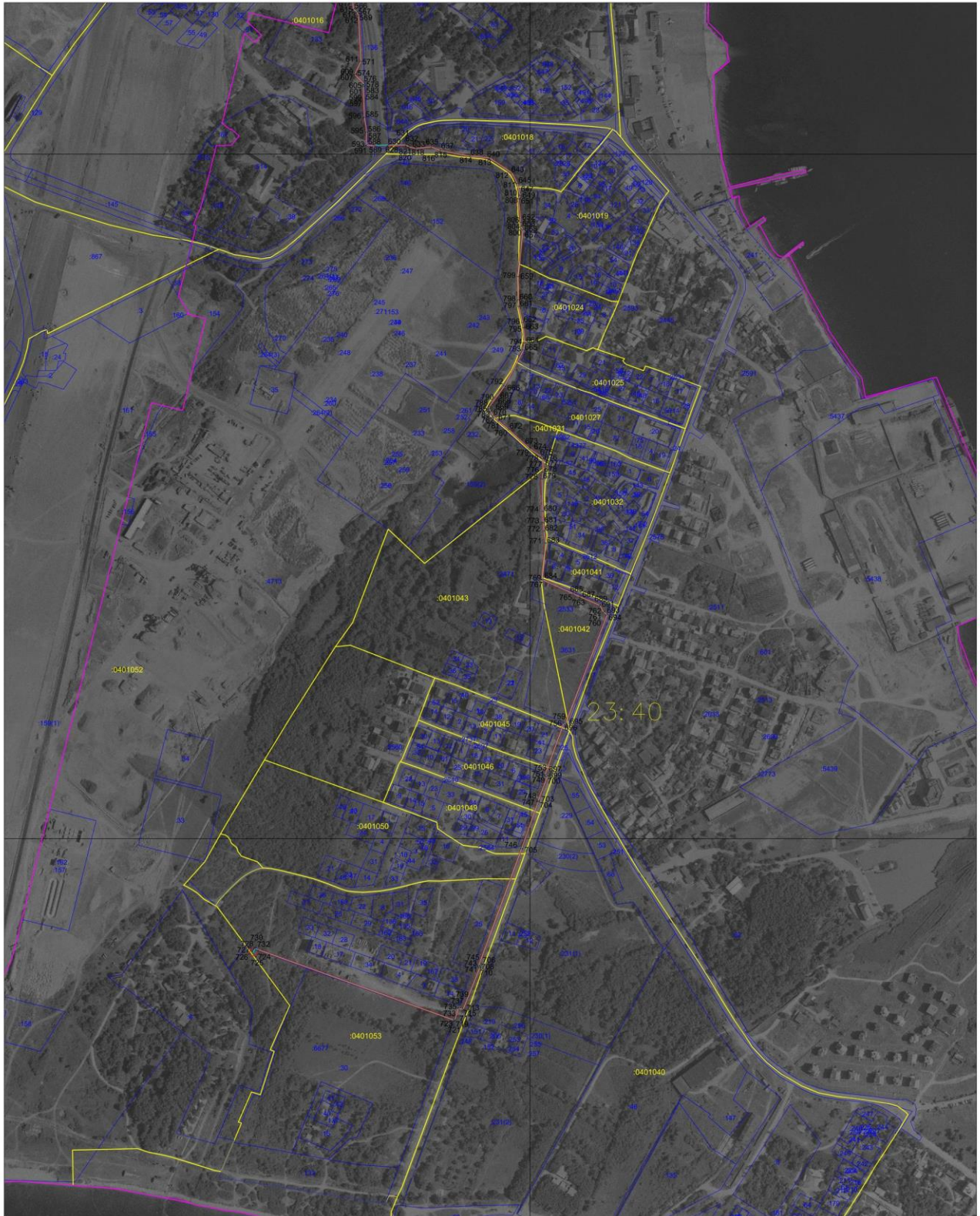
СХЕМА РАСПОЛОЖЕНИЯ ПУБЛИЧНОГО СЕРВИТУТА НА КАДАСТРОВом ПЛАНЕ ТЕРРИТОРИИ кабельной линии электропередачи «Строительство КЛ -10 кВ, СП -10 кВ и БКРП -10 кВ в г. Геленджик согласно договору технологического присоединения от 04.02.2020 № 21200-20-00547990-1 заявителем ООО «СПД» (стандартная ставка)