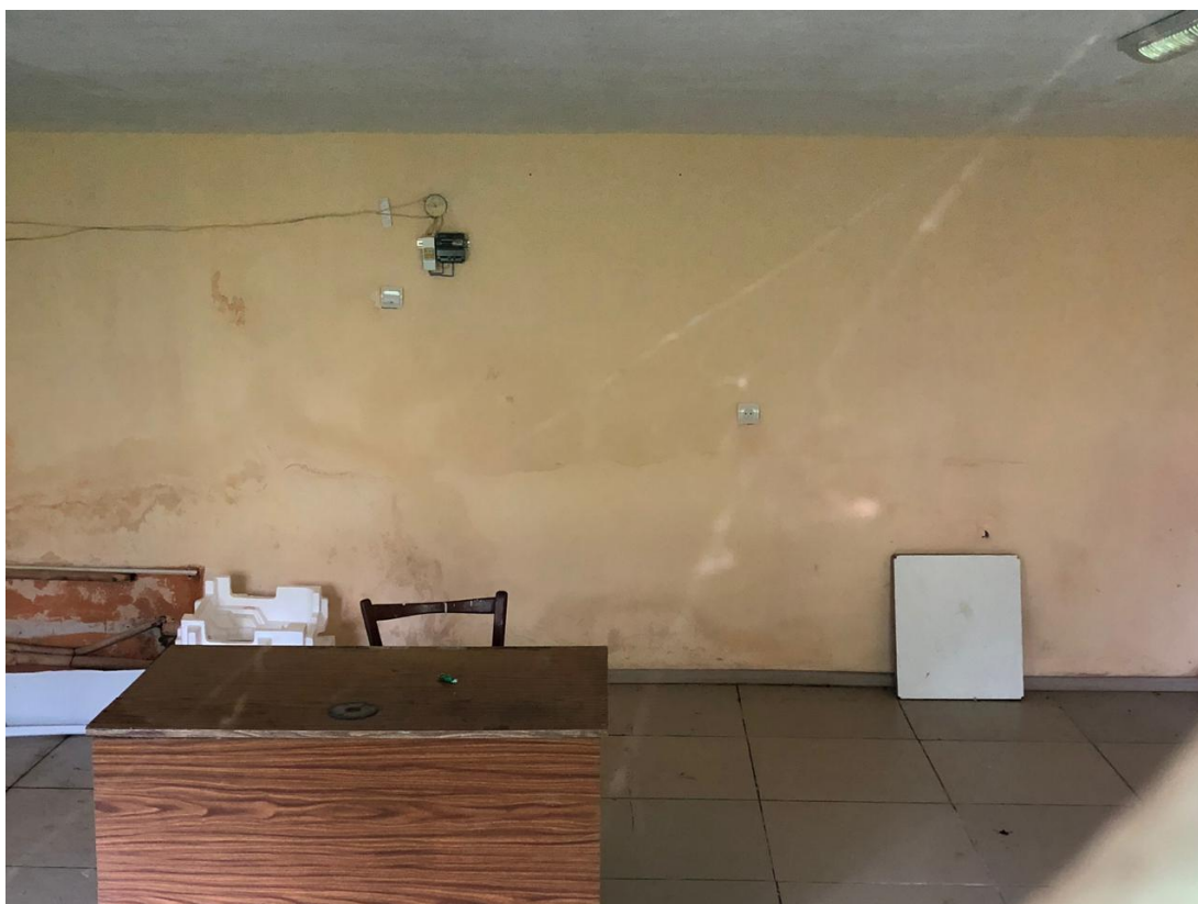
Фото № 8. Общий вид помещения № 5 в составе сдаваемых в аренду нежилых помещений общей площадью 42 кв.м