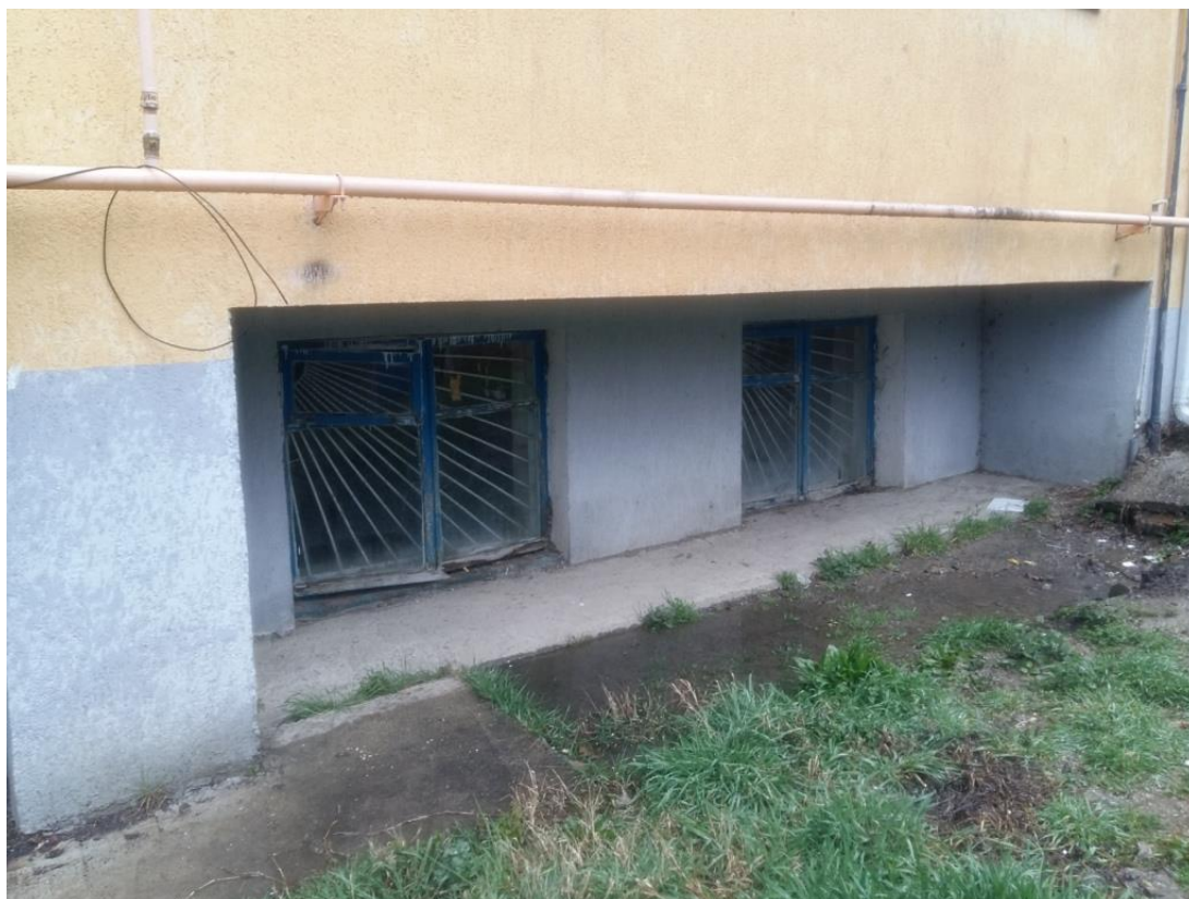
Фото № 3. Оконные проемы сдаваемых в аренду помещений (вид с улицы)