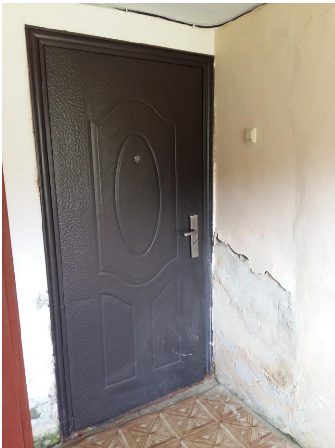
Фото № 4. Вход в сдаваемые в аренду помещения, вход осуществляется из небольшого коридора, из которого также осуществляется вход в соседние помещения, где размещается отделение почты