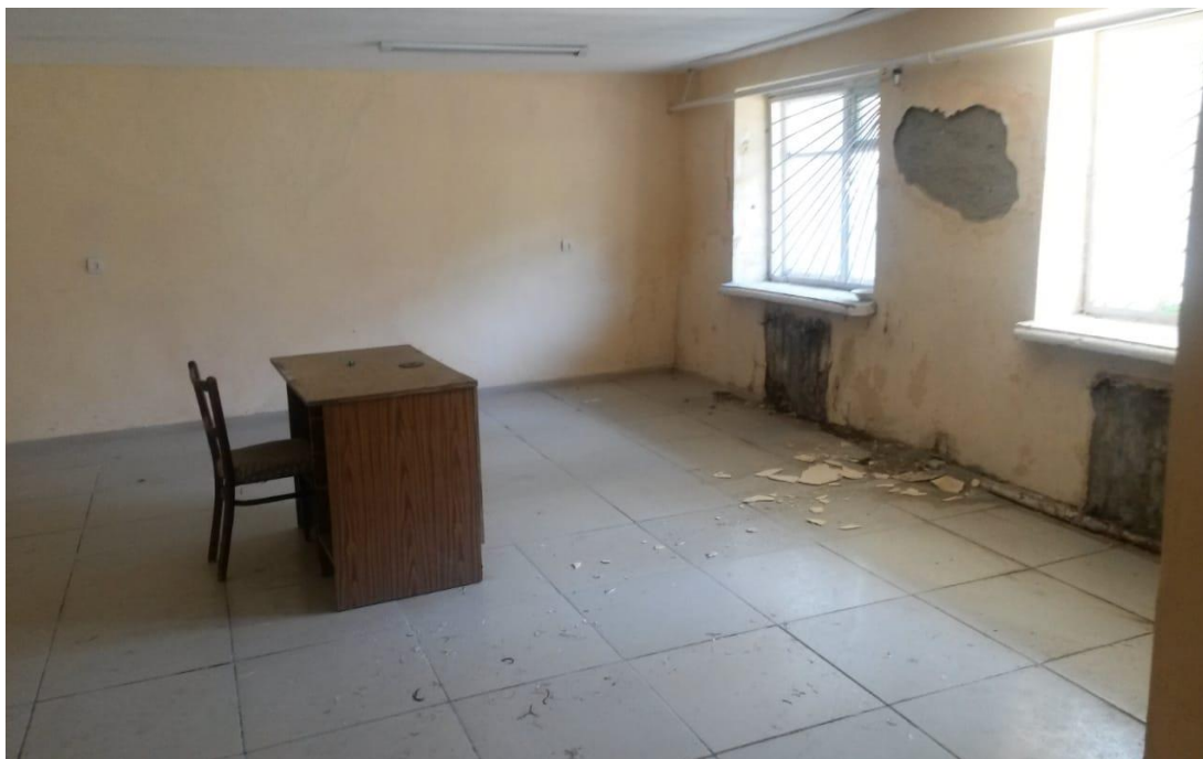
Фото № 6. Общий вид помещения № 5 в составе сдаваемых в аренду нежилых помещений общей площадью 42 кв.м