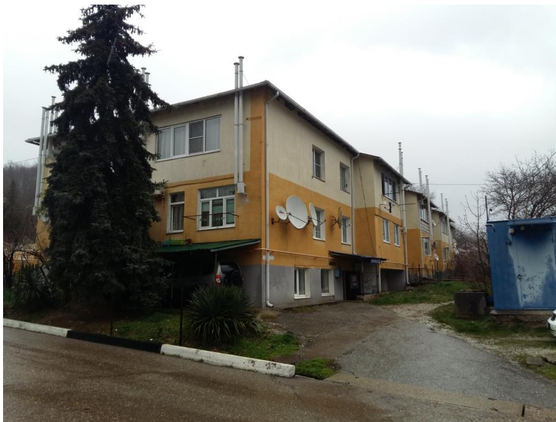
Фото № 1. Общий вид многоквартирного жилого дома, в котором сдаются в аренду нежилые помещения