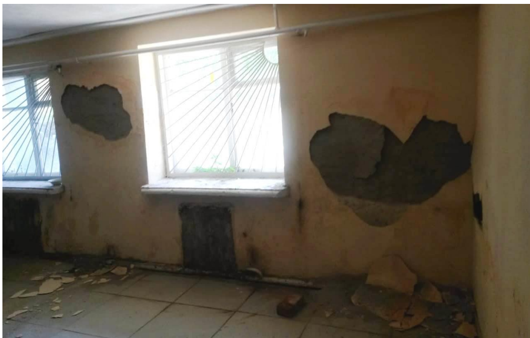
Фото № 7. Общий вид помещения № 5 в составе сдаваемых в аренду нежилых помещений общей площадью 42 кв.м