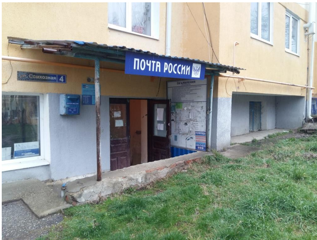
Фото № 2. Вход в помещения цокольного этажа многоквартирного жилого дома, в котором сдаются в аренду нежилые помещения