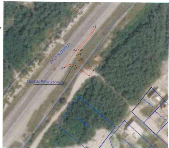
Система координат МСК-23

Условные обозначения: — граница публичного сервитута — граница земельного участка по сведениям ЕГРН — кадастровый номер земельного участка — номер кадастрового квартала — обозначение характерной точки границы публичного сервитута