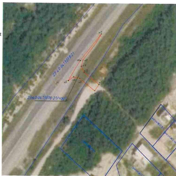
Система координат МСК-23

Условные обозначения: — граница публичного сервитута — граница земельного участка по сведениям ЕГРН 23:40:0201000:5 — кадастровый номер земельного участка 23:40:0413078:21 — номер кадастрового квартала • н.1 — обозначение характерной точки границы публичного сервитута