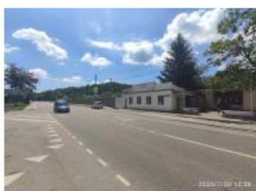
Фототаблица к Отчету об оценке № 82-20-1103/5 от 17.08.2020г.