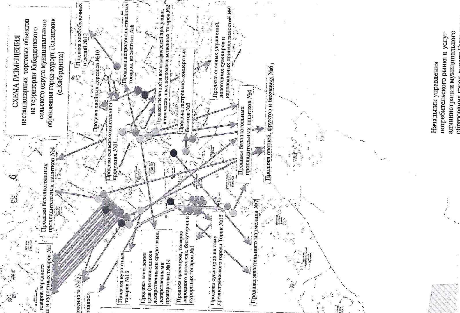
СХЕМА РАЗМЕЩЕНИЯ нестационарных торговых объектов на территории Кабардинского сельского округа муниципального образования город-курорт Геленджик (с. Кабардинка)